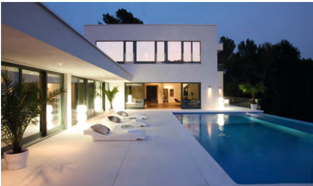
Luxusvilla 85% regenerativer Anteil am Energiebedarf