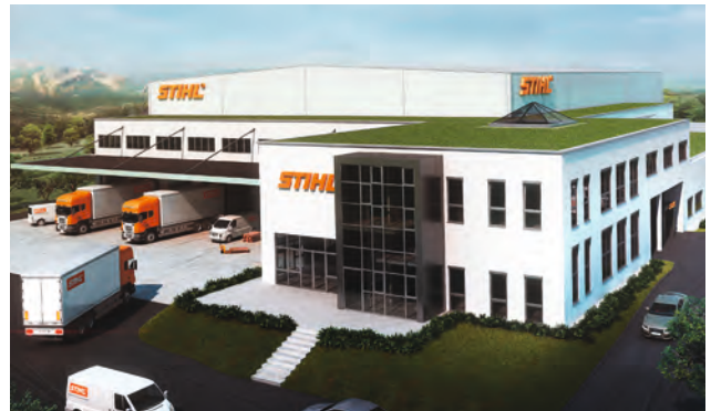
Firmenzentrale 100% regenerativer Anteil am Energiebedarf