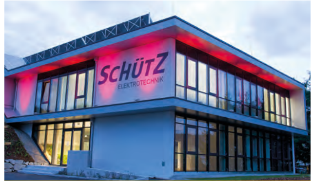
Büro- und Betriebshalle 100% regenerativer Anteil am Energiebedarf