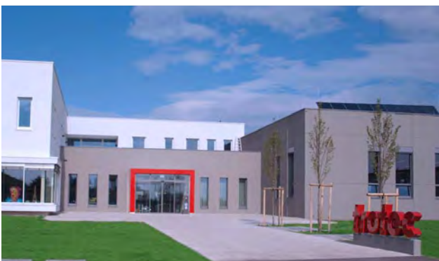
Büro- und Produktionsgebäude 100% regenerativer Anteil am Energiebedarf