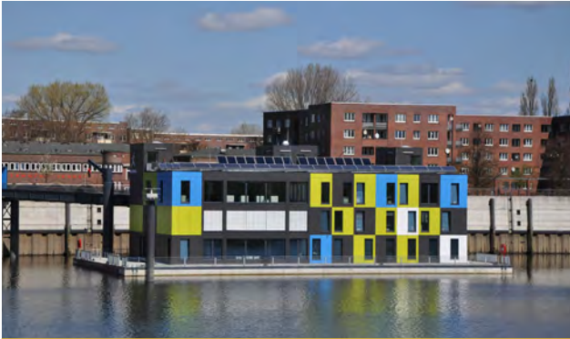
IBA-Dock 100% regenerativer Anteil am Energiebedarf